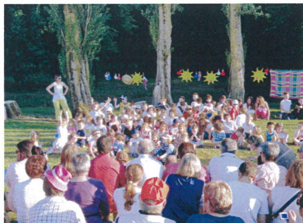
L'ensemble des enfants à la fête des écoles