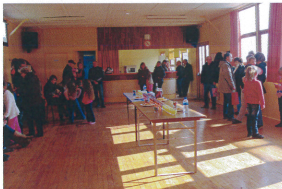
Cette chasse fut suivie d'un rafraîchissement.