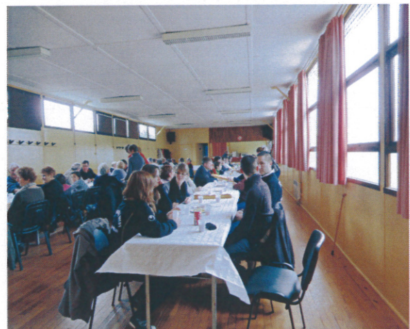
Le repas mais pas d'assiettes