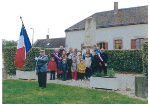
Les enfants et le Conseil