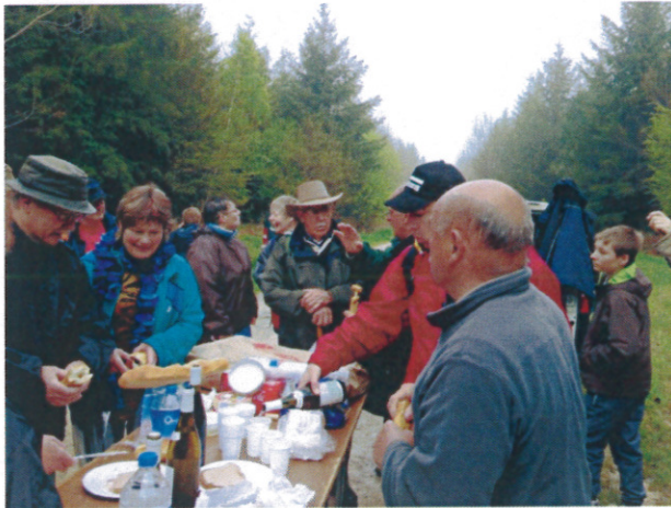
Le casse-croute de 10h