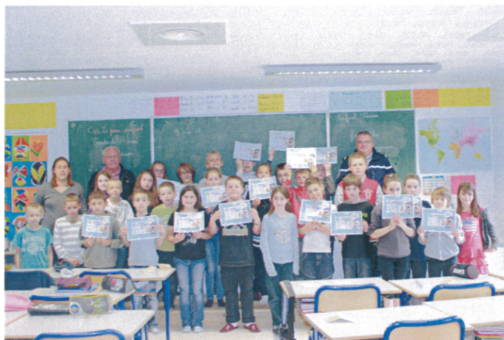
Les heureux lauréats

Pour répondre à ce questionnaire et obtenir le diplôme, la réflexion était de mise, chaque question comportait trois possibilités de réponse, ce qui n'a pas empêché la quasi-totalité des enfants d'obtenir ce précieux document, deux ont même réalisé un sans-faute.